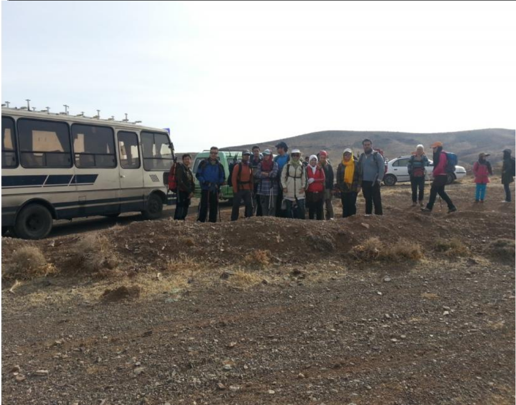
عکس های برنامه: